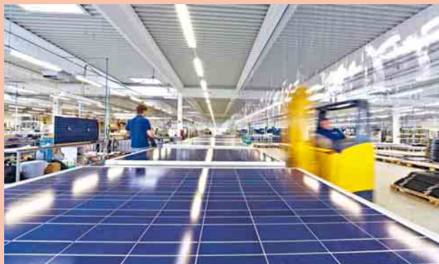
5 Centrosolar-Modulfertigung in Wismar