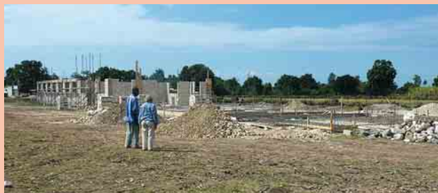
4 Der Rohbau des ersten Hauptgebäudes des CCFPL Anfang Februar