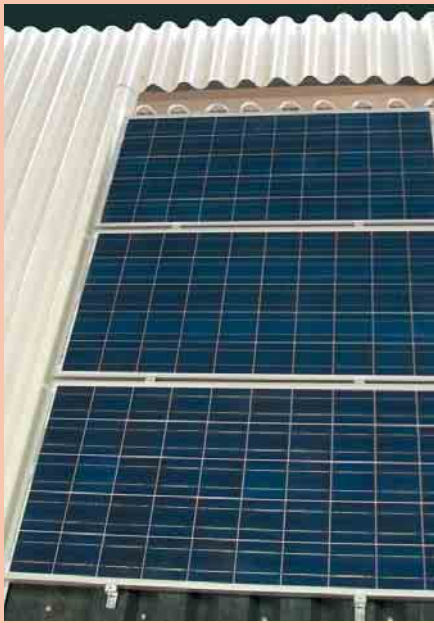
6 Solarmodule, montiert auf Montage-system Intersole XL von Renusol