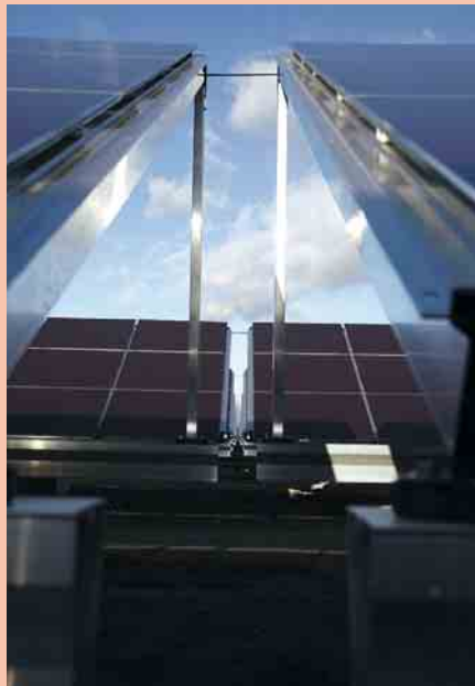
7 Dünnschichtmodule von Masdar PV