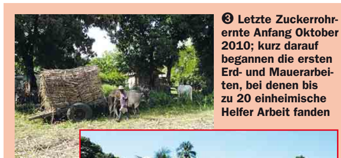
3 Letzte Zuckerrohr-ernte Anfang Oktober 2010; kurz darauf begannen die ersten Erd- und Mauerarbeiten, bei denen bis zu 20 einheimische Helfer Arbeit fanden